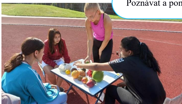
Poznávat a pomáhat