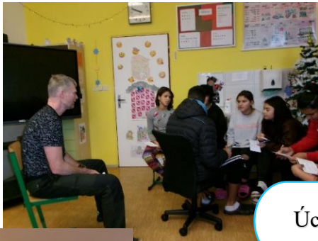
Úcta k životu