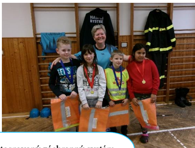
Integrovaný záchranný systém