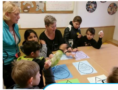
Den Země DDM