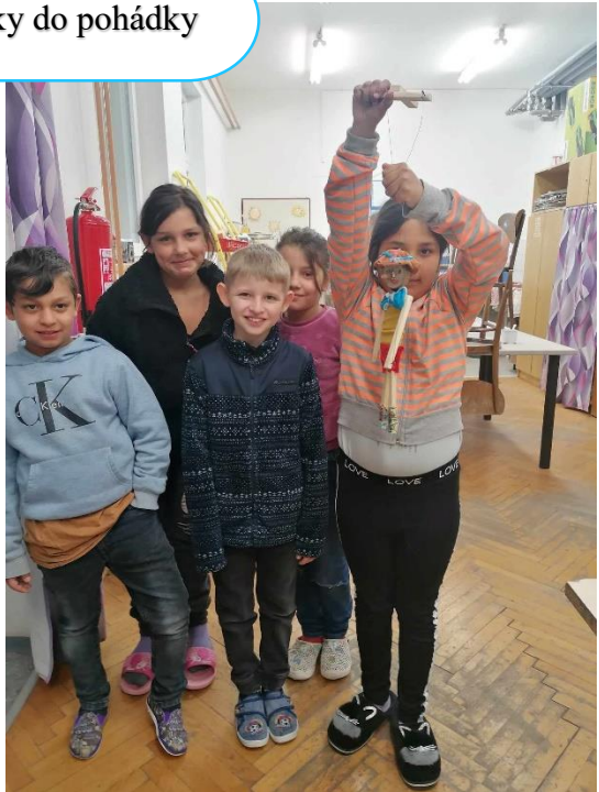
Z pohádky do pohádky