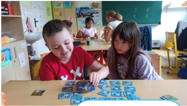
Můj domácí mazlíček