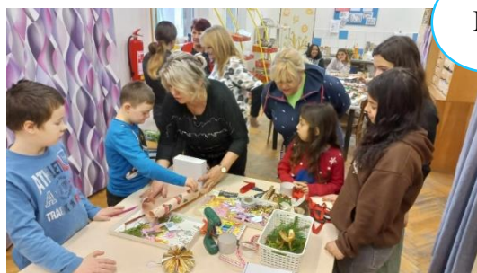
Balení vánočních dárků