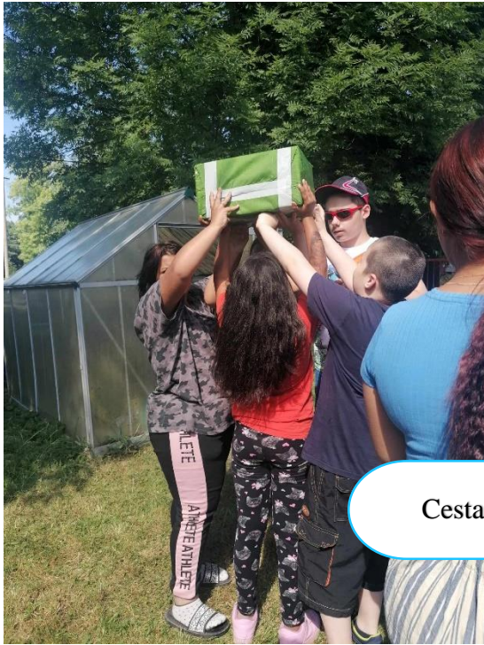
Cesta za pokladem