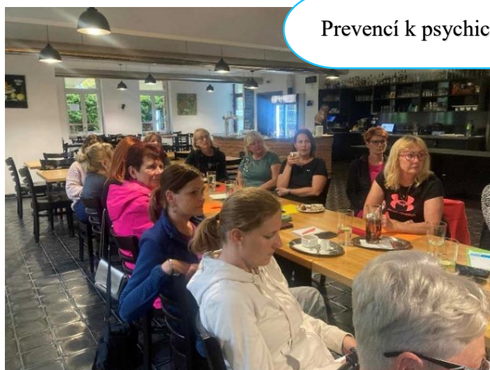
Prevenčí k psychické pohodě