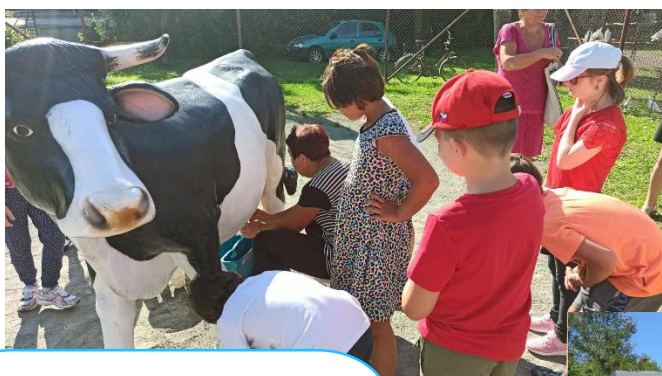
Výstava drobného zvířectva