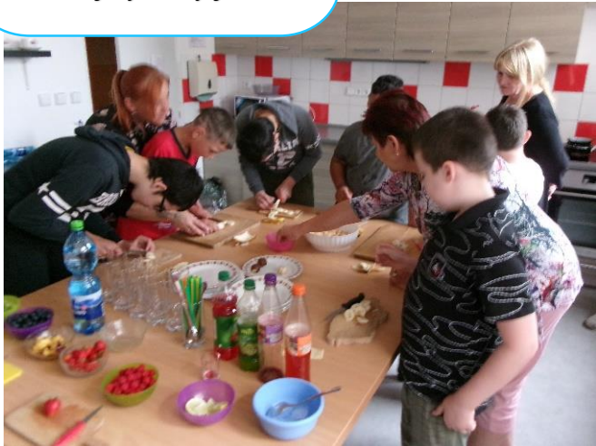
Můj vysněný job