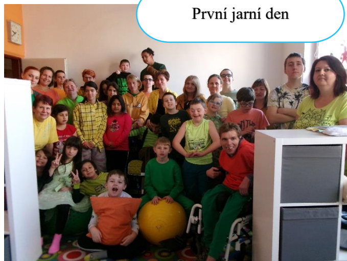
První jarní den