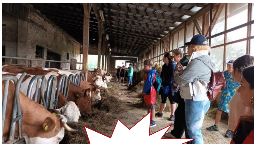
Zemědělské družstvo Dobruška