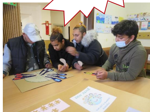
Příroda jako puzzle