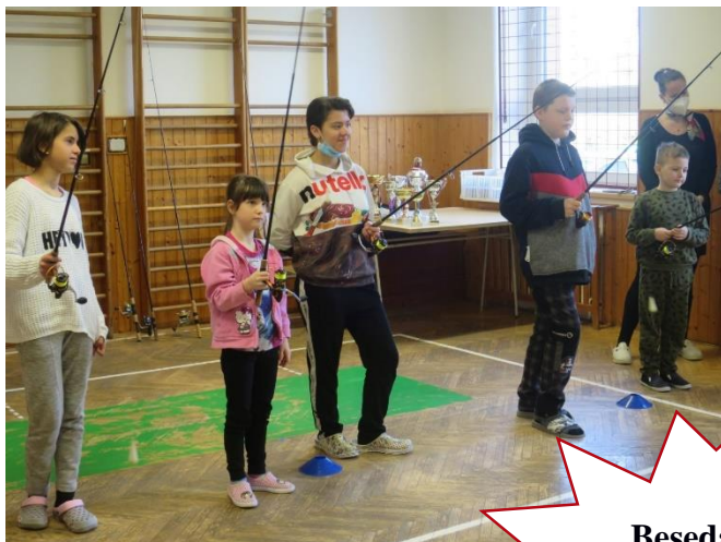
Beseda s rybářem