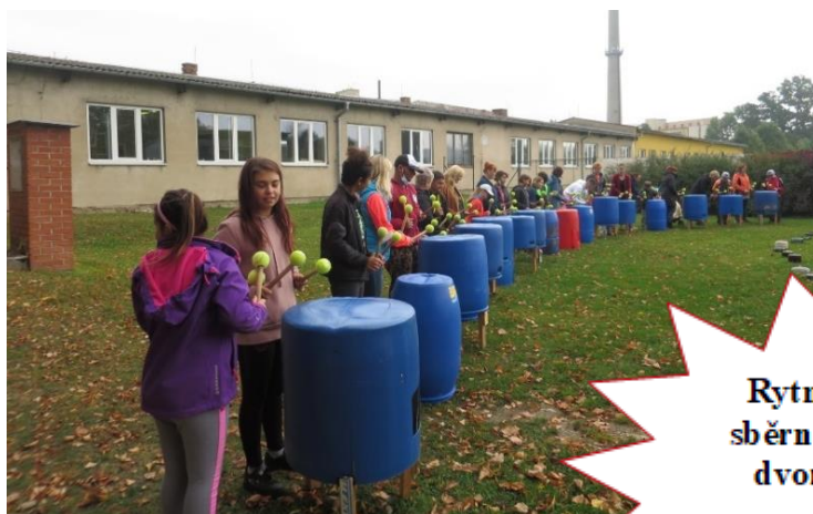
Rytmy sběrného dvora