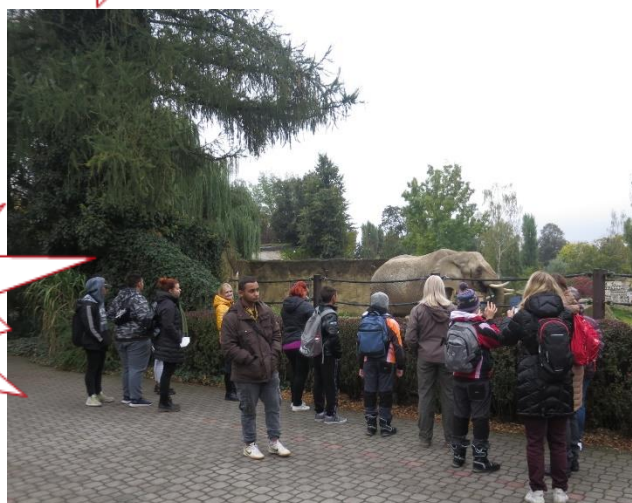
ZOO Dvůr Králové n. L