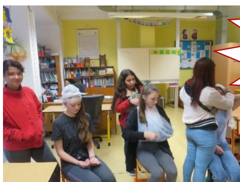
Zdravotnická soutěž Úpice