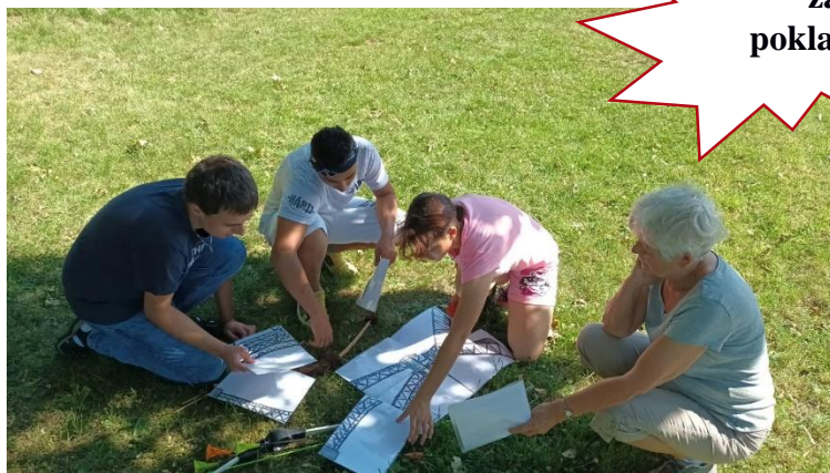
Cesta za pokladem