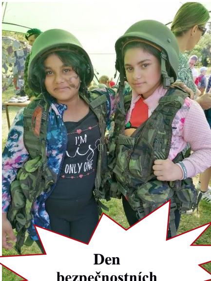
Den bezpečnostních složek