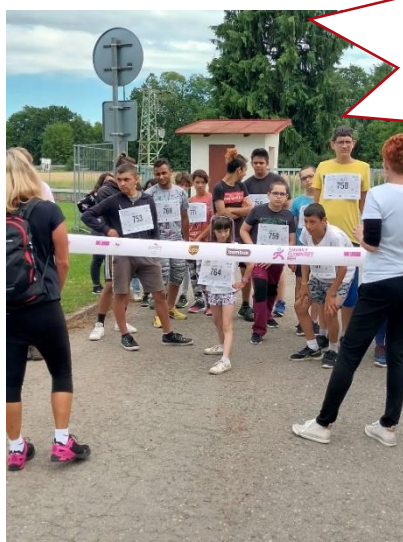
T-mobile olympijský běh