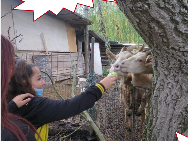
Exkurze na statku