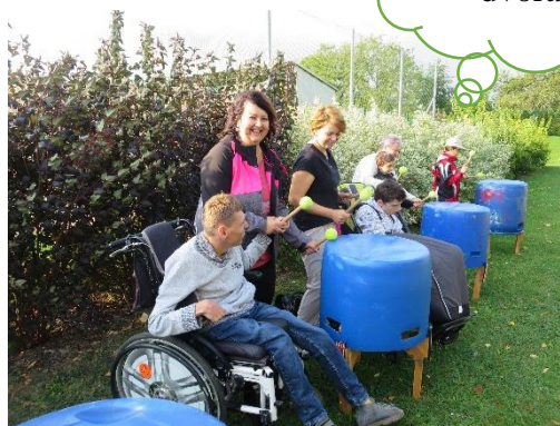
Rytmy sběrného dvora